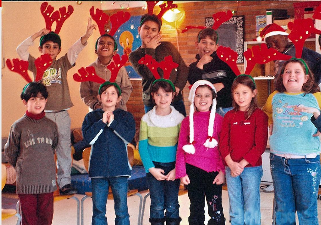
Elchgrüße von der GGs Sonnenstraße

Danke für Ihre Aufmerksamkeit und ein gutes NEUES JAHR !